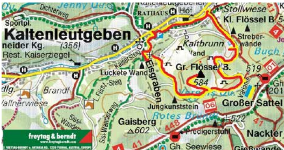
Bild 1 Karte Freytag & Berndt

in der Barockkirche wird dieser Weg führen und weiter oben auf der Eiswiese werden unsere Eisschützen und Fußballer live zu erleben sein. Es wird eine Masken-Ausstellung und viele Sehenswürdigkeiten mehr geben und der erste Abend wird mit einer Feuershow enden.