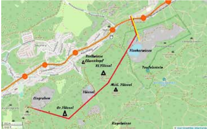
Seilbahn vom Großen Flösselberg

Weiter geht es am Gratrücken entlang, um gleich dahinter die Fundamentreste der Seilbahn-Umlenkstütze zu entdecken. Etwas weiter unten befand sich die Umlenkstation Flössel dieser Seilbahn, die unter Kontrolle der Feuerwehr Kaltenleutgeben im Zuge der Abbrucharbeiten in Form einer Übung „warm abgetragen“ wurde. Jetzt gäbe es natürlich für sehr gute Geher die Möglichkeit einer Überschreitung. Erst ein Stück die Seilbahnschneise entlang und dann über Steilgelände sehr beschwerlich bis direkt hinter zur Flösselgasse, wobei wir uns aber zur Rückkehr zum Sattel entscheiden.