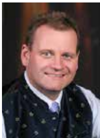
Hannes STIEHL Vizebürgermeister, Gfhr. GR für Jugend und Sicherheit