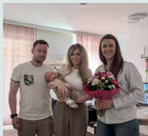
Familie Raitmar zur Geburt ihres Sohnes