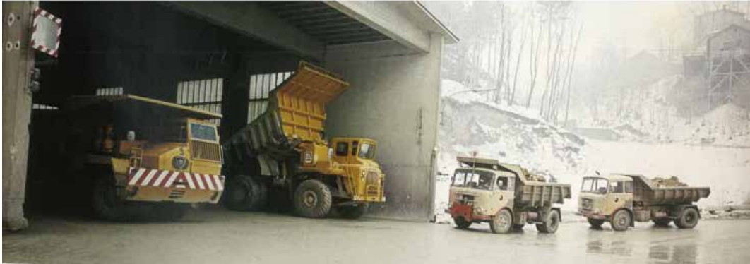
Foto: Brecherhalle bei der Waldmühle © Archiv der Perlmooser Zementwerke AG

Was ist Branntkalk und Zement? Warum wurde hier jahrhundertlang Kalk gebrannt und warum wurden bis in die 90er Jahre Steinbrüche für das Zementwerk in der Waldmühle betrieben? Diese Fragen stehen im Mittelpunkt unseres nächsten Ortsspaziergangs in die Steinbrüche von Kaltenleutgeben. Abbau und Verarbeitung von Kalk und Mergel haben den Ort über Jahrhunderte geprägt. Nunmehr sind die Steinbrüche vom Menschen geformte Naturlandschaften geworden.